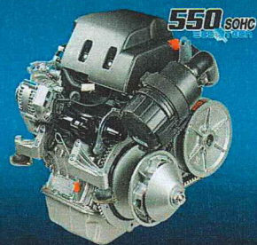
DIESEL EURO 5