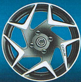
JANTES ALLIAGE 16"