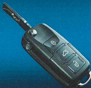
TÉLÉCOMMANDES À 3 BOUTONS